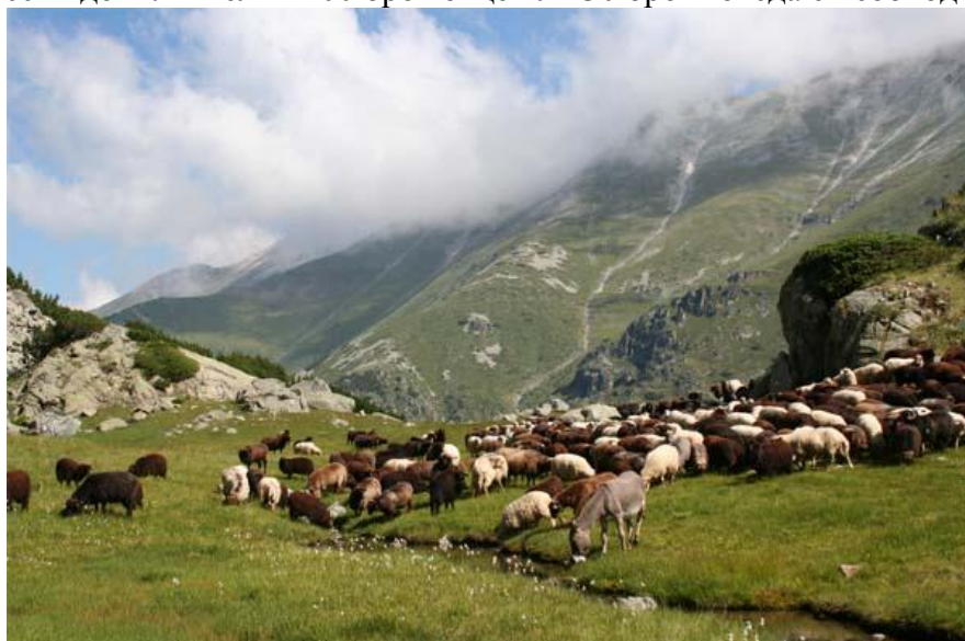
Специфични декларации по направлението

Броят на кучетата е пропорционален на общия брой овце или говеда, които трябва да бъдат охранявани. Две каракачански кучета могат да охраняват стадо от 100 овце или 30 говеда, като за всеки допълнителни 100 броя овце или 30 броя говеда е необходимо по още едно куче.